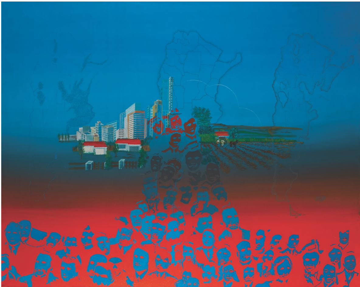
ELDA CERRATO. Serie: Para una Imagen del Hombre IV , 1976. Acrílico sobre tela. 115 x 145 cm