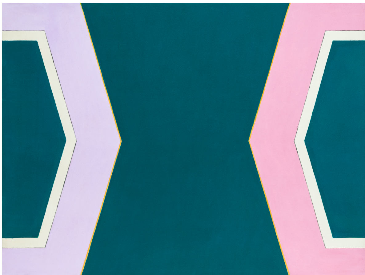
ALEJANDRO PUENTE. Pintura , 1965. Acrílico sobre tela. 96 x 128 cm

Herlitzka + Faria Libertad 1630 - Buenos Aires C1016ABH Tel.: + 54 11 4313 2993